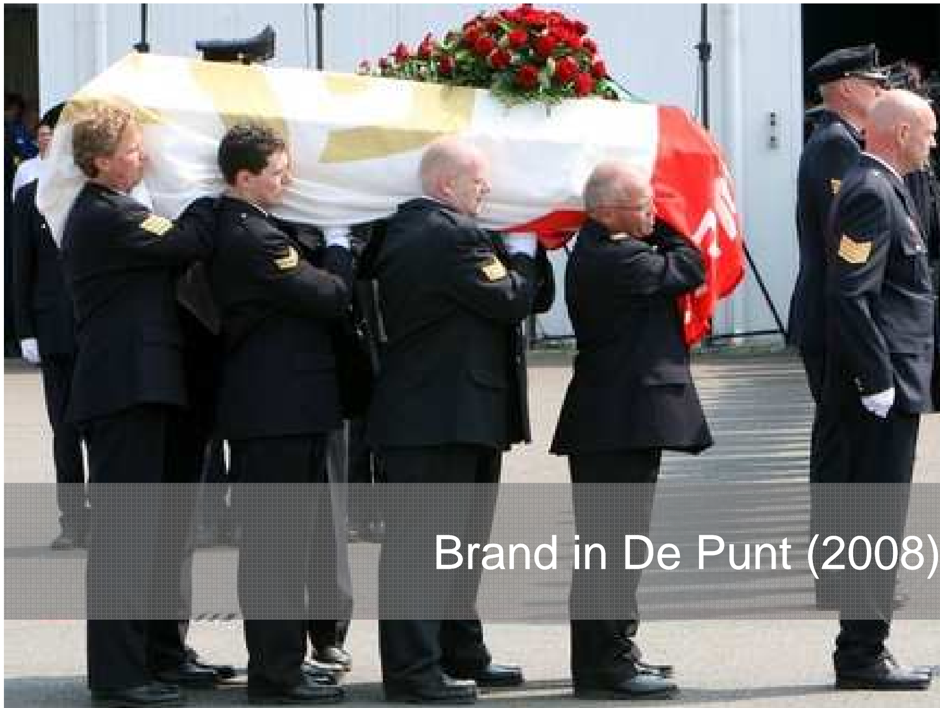
Brand in De Punt (2008)