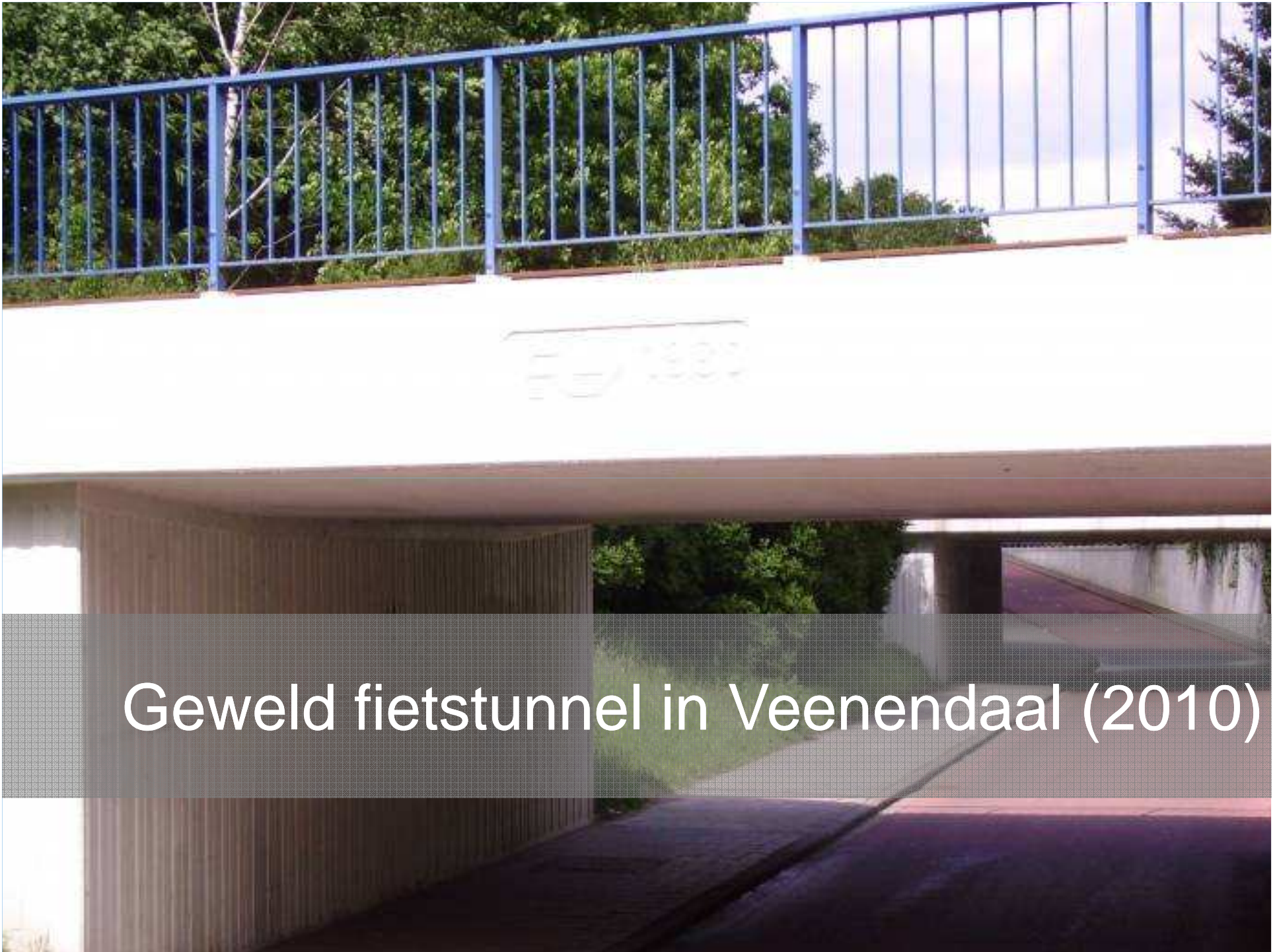
Geweld fietstunnel in Veenendaal (2010)